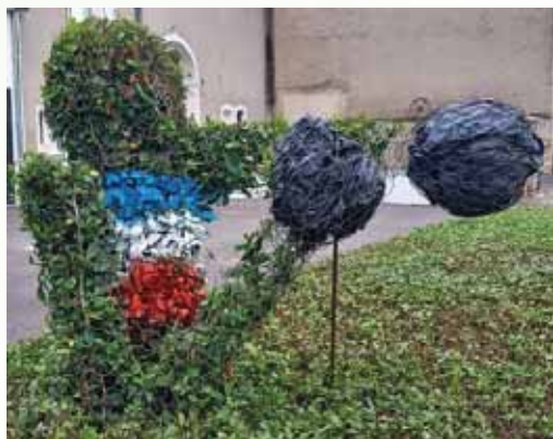
Boxeur de François

Pour les associations uniquement, le ménage sera facturé 40 € si la location n'est pas suivie d'un repas et de 80 € si elle comprend le repas.