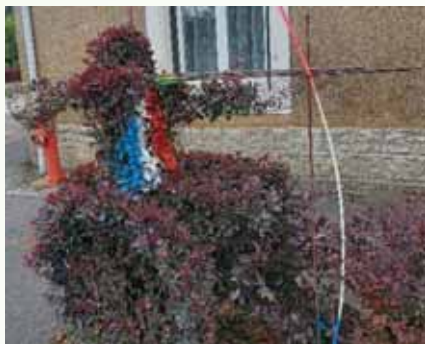
Tir à l'arc paralympique

François a fabriqué les supports grillagés et les a installés d'une façon stratégique, aux deux entrées du bas du village. La pousse s'est faite assez rapidement car une haie peut grandir jusqu'à 1 mètre chaque année ! Il taillait tout d'abord le tour de ses créations pour laisser l'équipe de Arnaud Tollot tailler tout le reste de la haie comme habituellement.