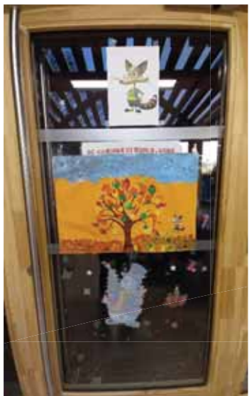
BAZ personnage imaginaire

Au début de la garderie du soir, chaque enfant aura la possibilité de prendre une collation. A la demande des parents, l'aide aux devoirs en priorité se met en place, puis des ateliers créatifs, des jeux à l'intérieur ou à l'extérieur seront proposés aux enfants.