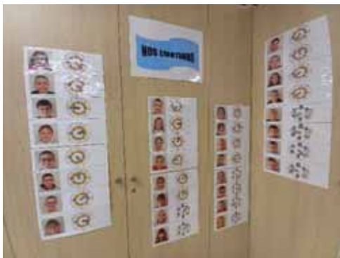
Tableau des émotions

Puis à midi cantine avec des repas élaborés par la cantine du collège Charles Edouard Fixary de Liffol-Le-Grand. Après le repas, les enfants joueront librement à l'extérieur ou à l'intérieur suivant la météo.