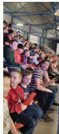
Sortie basket Nancy

L'association a proposé une sortie au Nancy SLUC basket et un atelier bricolage de Noël.