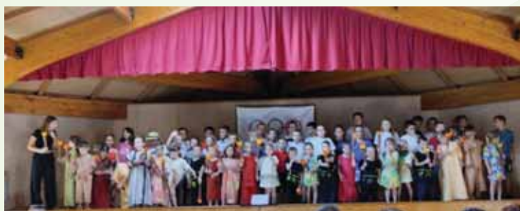
Fête de l'école

Contrairement à l'année dernière, pas besoin de Cotiser !