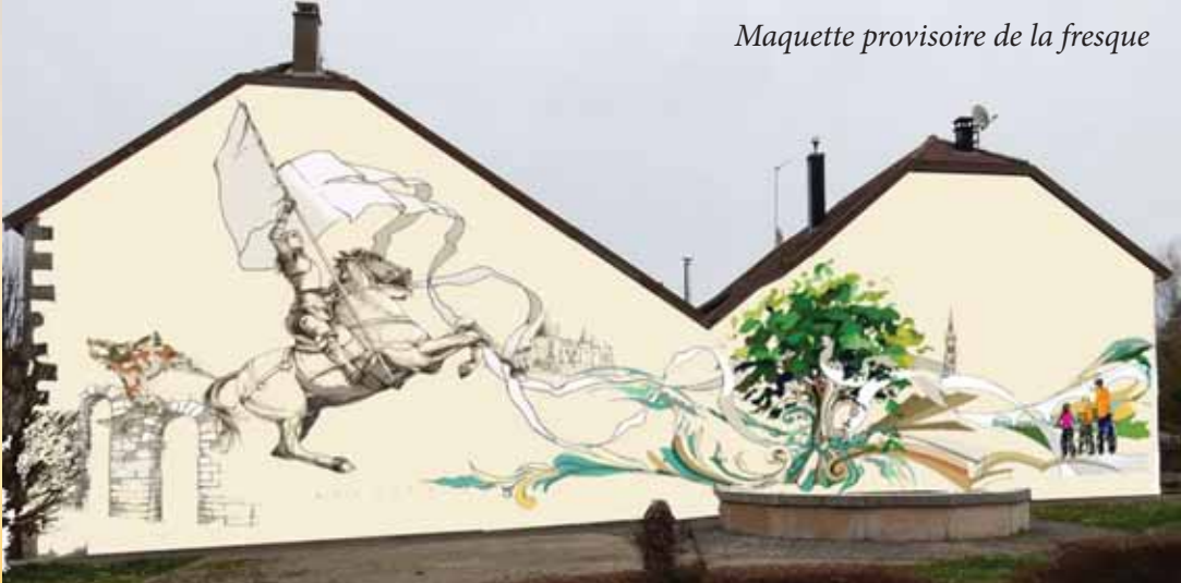
Maquette provisoire de la fresque