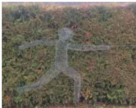
Escrimeur de François

La vaisselle est fixée à 1,50 € / personne. La vaisselle cassée ou manquante sera facturée.