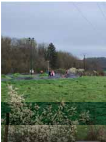
Chasse aux oeufs à Pâques

Pour 2025, l'association souhaite poursuivre dans cette voie. Nous comptons sur vous pour continuer de nous soutenir et de participer à la vie du village. Pour cela, il vous suffit de vous inscrire aux diverses activités proposées que vous trouverez sur le site de la mairie de la mairie et sur Facebook.