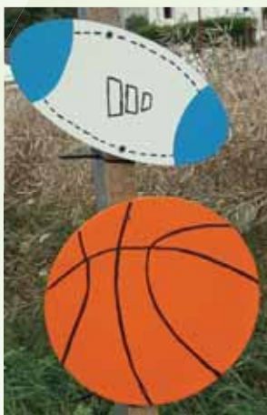
Décos du CMJ