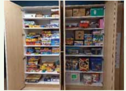
Armoire à jeux de société