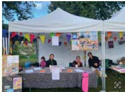
Balade de la Vallée de la Meuse