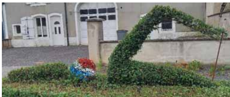
Nageur de François