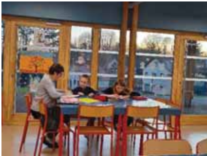
Aide aux devoirs

Maintenant, place aux utilisateurs de ce périscolaire !