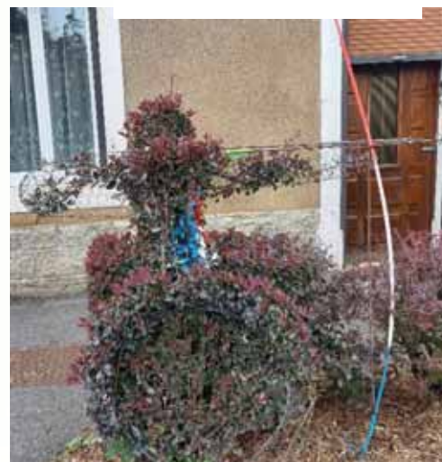
Tir à l'arc paralympique