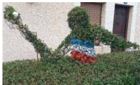
Ping Pong de François